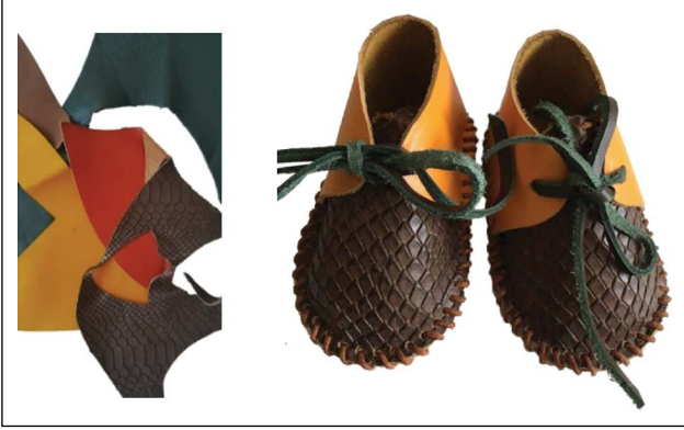
Şekil 8. Atık parça derilerden patik.