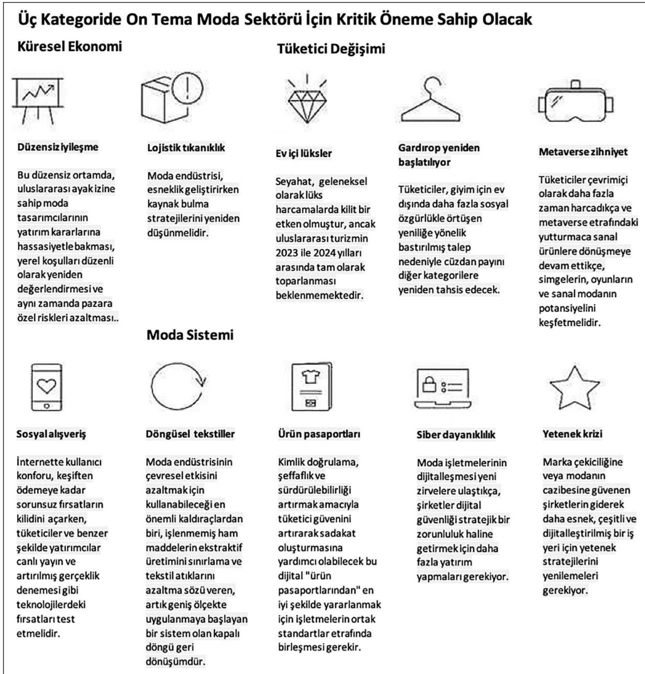
Şekil 6. McKinsey & Company, The Fashion State 2021 raporu.

McKinsey ve The Business of Fashion (BoF) iş birliği ile sektör profesyonellerince hazırlanan "The State of Fashion 2020" raporu ve "The Fashion State 2021" raporunda "sürdürülebilirlik" kritik 10 temasından biri olan "Less is More" yani "Az Çoğtur" başlığında; artık daha az üreten markaların ve daha az tüketen bilinçli tüketicilerin sürdürülebilir moda yönüne doğru söz ediliyor. 5 McKinsey & Company "The Fashion State 2021" (Şekil 6) raporuna