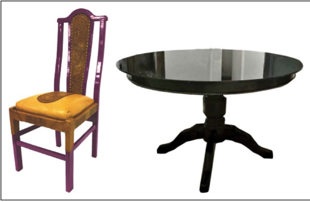
Şekil 9. Çöpe atılmış sandalyeden deriyle yapılan tasarım, çöpe atılan masanın geri dönüşümü.

ğim çalışmalarım da oldu. Bunlar çok değerli. Çok kıymetli. Atıl ve/veya atık durumda olan birçok malzeme küçük veya gerektiği kadar tasarımsal dokunuşlarla tekrar kullanıma kazandırılabilir. Bunlardan bazı örnekler (Şekil 9).