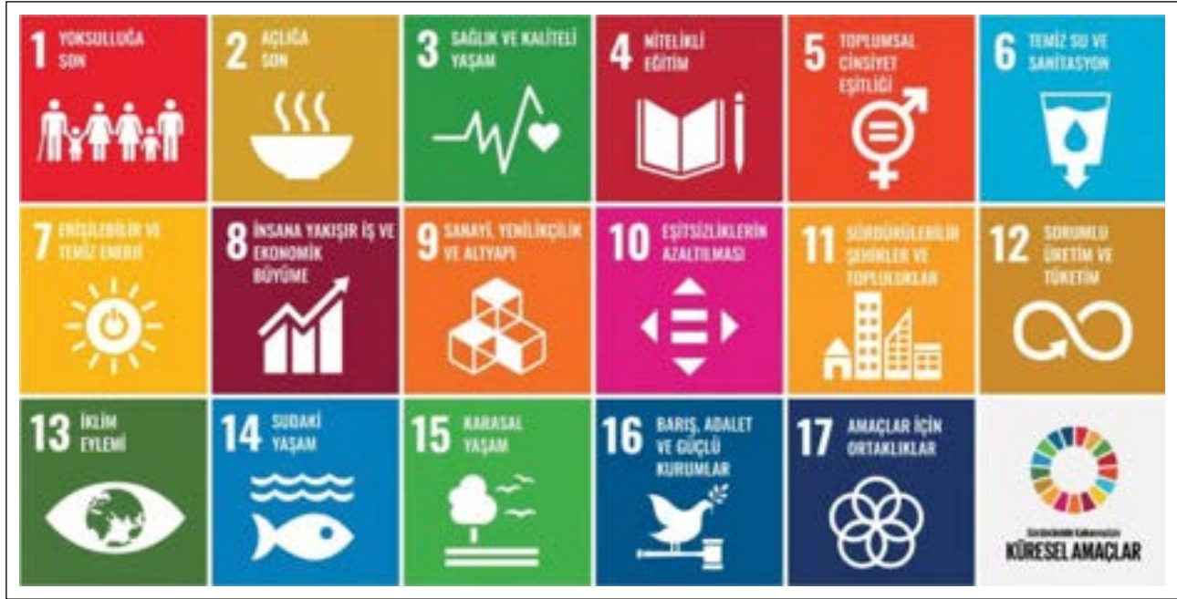
Şekil 3. Küresel amaçlar.

2030 yılında tamamlanan bir yol haritası olarak Sürdürülebilir Kalkınma Amaçlarını (SKA) kabul etti. Tüm milletlere yönelik ve kimseyi geride bırakmayacak şekilde düzenlenen “2030 Gündemi” nin temelinde arzuladığımız dünyayı açık bir şekilde tanımlayan 17 Sürdürülebilir Kalkınma Amacı (SKA)ler) (Şekil 3) bulunmaktadır.”