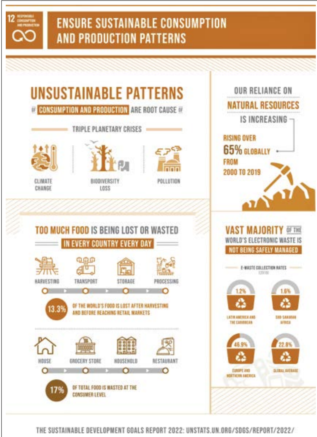
Şekil 1. 2022 Sürdürülebilir Kalkınma Hedefleri Raporu, Madde 12. Sorumlu Üretim ve Tüketim, Sürdürülebilir tüketim ve üretim kalıplarını sağlamak.

rülebilir tüketim ve tüketici davranışları değişim ve gelişimi nedenselliği ele alınmış, çalışmanın ana temasını oluşturan, “Sorumlu Üretim ve Tüketim” sürdürülebilirlik, tüketim ve sürdürülebilir tüketici davranışları ile bu oluşumda sanatın bulunduğu yer ve sürdürülebilir sanat konuları üzerinde durulmuştur.