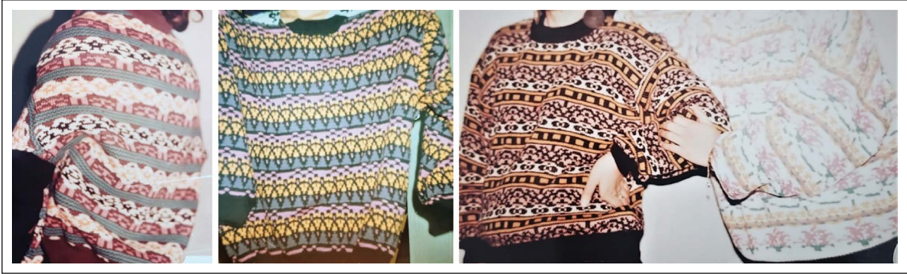
Şekil 4. Penye Triko Kazak Örnekler © Tamer Aslan, SÖKSA 1991–92.