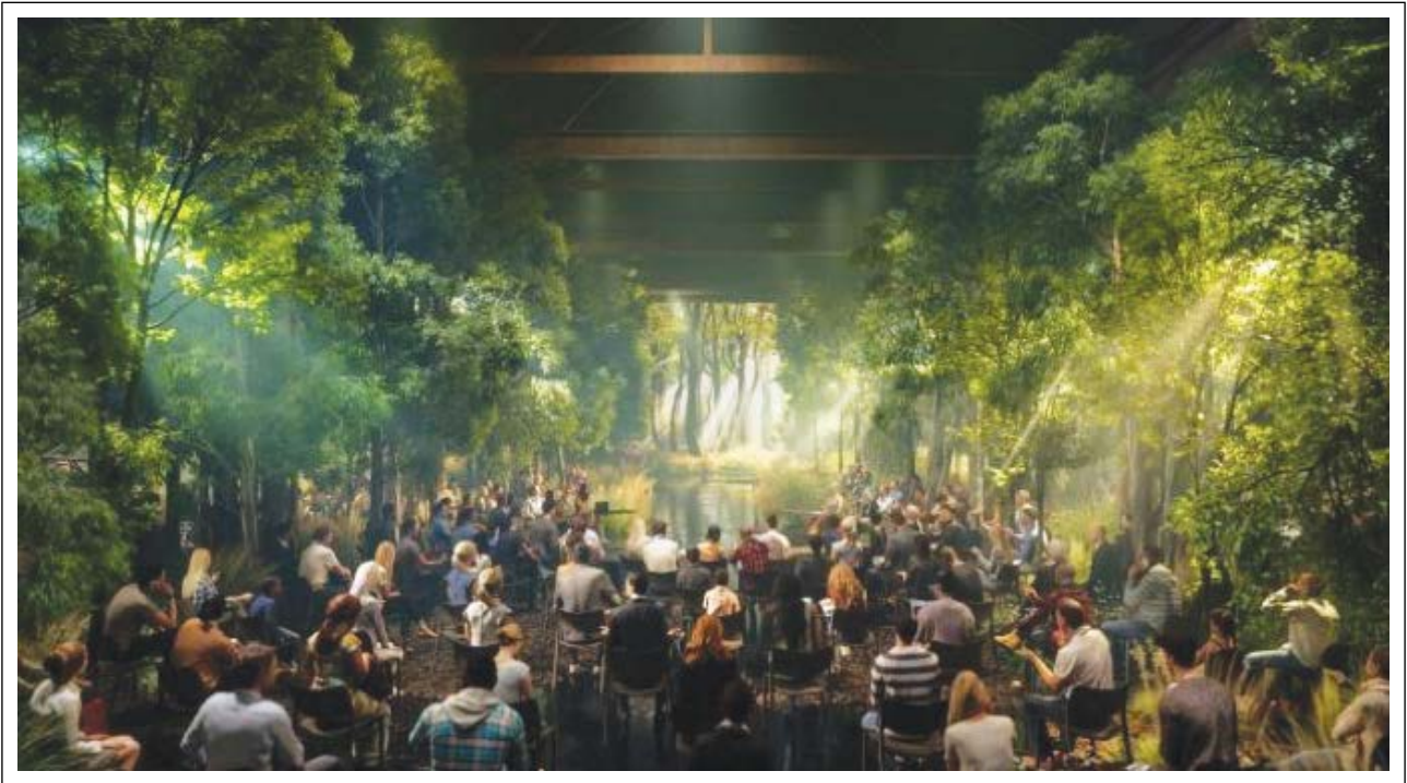
Şekil 10. Es Devlin’in Ağaçlar Konferansı.

Kasım 2021’de Glasgow’da düzenlenen Birleşmiş Milletler iklim konferansı COP26 çerçevesinde sanat ve kültürün rolünü araştıran yeni bir rapor yayımlandı. Küresel iklim konferansında sanatsal ve kültürel aktiviteler yer aldı. Bu anlamda COP, sanatçılara daha çevreyle ilgili yeni bir şeyler yapma şansı verdi (Şekil 10).