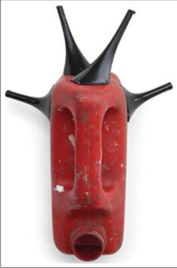
Şekil 7. İleri dönüşüm sanatı. Romuald Hazoumè'nin tamamen atılmış plastik benzin kaplarından yapılmış Afrika Maskeleridir. Sotheby's aracılığıyla 17.000 £'a satıldı (Nisan 2019).

tişimde bulunduğunuz insanlara kadar süregiden anlayış, kısacası "sadeleş" anlayışıdır.