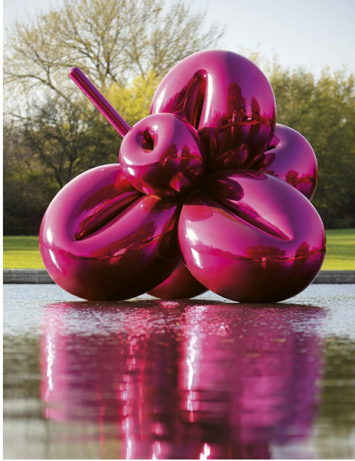
Görsel 6: Jeff Koons, 1955, Şeffaf renk kaplamalı Balon Çiçeği (Macenta) yüksek krom paslanmaz çelik 133 7/8 x 112¼ x 102 3/8 inç. (340 x 285 x 260cm)

Anti-modernist bir tavır olarak değerlendirilebilen postmodernizm, eklektik bir yapıyı barındıran, özgün, üslup, nitelik gibi seçkin nitelikleri olmayan, kitsch, karışık, kaos barındıran eserlerin oluşturduğu, kuralsız bir yapı içerisinde karşımıza çıkmaktadır. Modernist anlayış ve görüşlerinin çoğuna karşı tavır sergileyen postmodernist olarak niteleyebileceğimiz sanatçılar, modernizmin sanatın metalaşması, sürekli yenilikçilik, geçmişin reddi gibi konularla ilgili eleştirel tavır geliştirmişlerdir (Şahin, 2012, s.92).