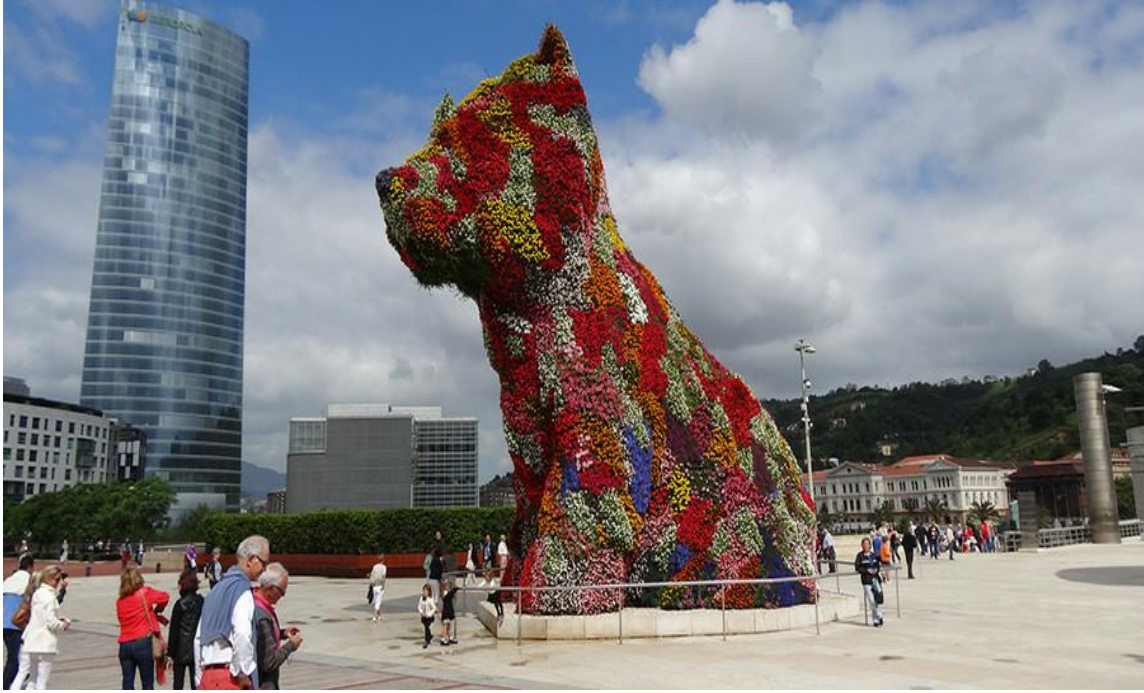
Görsel 5: Jeff Koons, “Puppy”, İspanya

Jeff Koons popüler imgelerin farklı boyutlarda farklı malzemelerle birleşimini sağlayarak alışılmışın dışında mekânlarda yer almasını sağlamaktadır. İzleyiciyle iletişimin ön planda olduğu Koons eserleri balonlardan, çiçeklerden, vakumlu süpürgelerden oluşabiliyor. Dev boyutlarda hayvan figürleri veya popüler imgelerle de karşılaşılmaktadır. Jeff Koons’un eserlerinde sıkça karşılaştığımız kavramlardan birisi de “kitsch” kavramıdır. Sanatçı sıradanlaşmış gündelik yaşamda karşılaştığımız hiçbir özelliği olmayan kitsch nesnelere kendi sanat eserleri içerisinde tekrar dikkat çekmektedir. Tüketimin ve sanat nesnelерinin sıradanlaştığı, hızla çoğaldığı ve kolay oluşabildiği günümüz sanatına da ironik bir göndermede bulunan sanatçı; çağdaş sanatın içerik kavramıyla da izleyiciyi yüzleştirmektedir.