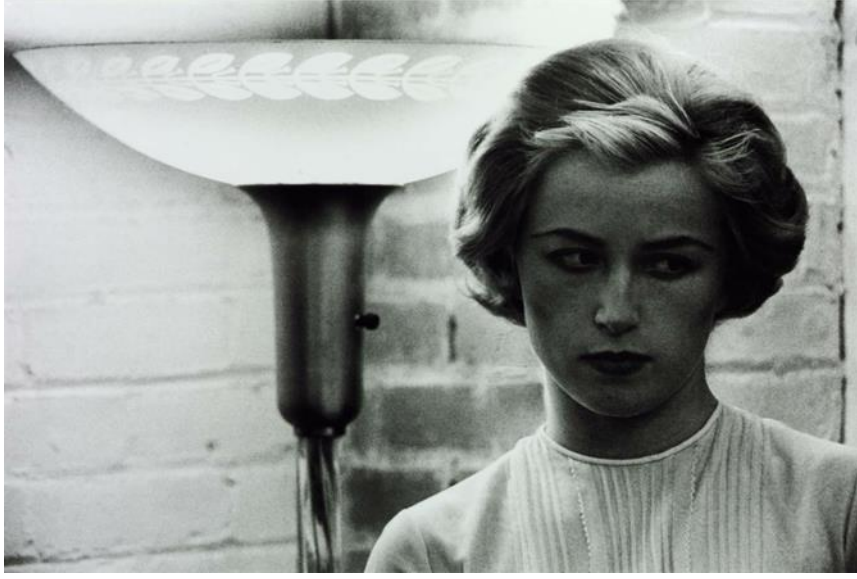
Görsel 1: Cindy Sherman, İsimli Film Hala #53 Untitled Film Still #53), 1980, Fotoğraf, Kâğıt üzerine gümüş baskı, Görsel: 695 x 970 mm, Yeniden basım 1998, Tate

Eskinin ve yeninin bir arada olması fikri ile yola çıkan postmodernizm; çağdaş sanatın eserleri içerisinde de sanatın temel fikirlerini de özümseyerek içinde barındırır. Bu nedenle fotoğraf sanatı; farklı sanatlarla bir araya gelerek derlemeler, yeniden oluşturmalarla karşımıza çıkarak sanatın üretim şekillerinin çeşitlendiği çoğulcu bir bakış açısı da sunmaktadır. İzleyici de sanat ortamındaki çeşitli bakış açılarını bir arada özümseyerek yadırgamamaktadır.