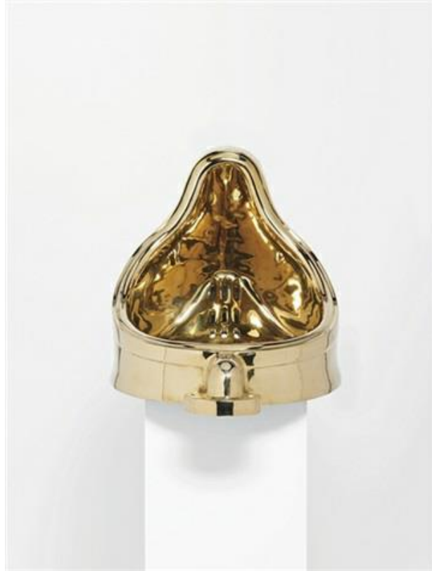
Görsel 4: Sherrie Levine, Çeşme (Marcel Duchamp'tan sonra) , 1991, 66,1 x 36,8 x 35,6 cm. (26 x 14,5 x 14 inç)

Fotoğraf imgelerine eserlerinde sıkça yer veren Sherrie Levine ise tarihsel öneme sahip olan sanatçı çalışmalarını yeniden gün yüzüne çıkararak yorumlamaktadır. Fotoğraf sanatını kavramsal işlerle buluşturan Sherrie Levine; eserlerinde genellikle Barbara Kruger gibi temsil üzerine odaklanan çalışmalara yönelerek, sahiplik ve anlam kavramlarını incelemektedir. Postmodernizmde karşılaştığımız mal etme eylemini Sherrie Levine eserlerinde sıkça gerçekleştirmektedir. Sanatçı bulunduğu sanat ortamında söylenecek başka sözün ve eylemin kalmadığı düşüncesinden hareketle tekrar eden işleri fotoğraflayarak, kitle iletişim araçlarını da kullanarak farklı imgelere dönüştürmektedir. Yeniden düzenleme ve kompoze etme fikrini, öznel birikim süzgecinden geçirerek geçmişi sorgulamaktadır.