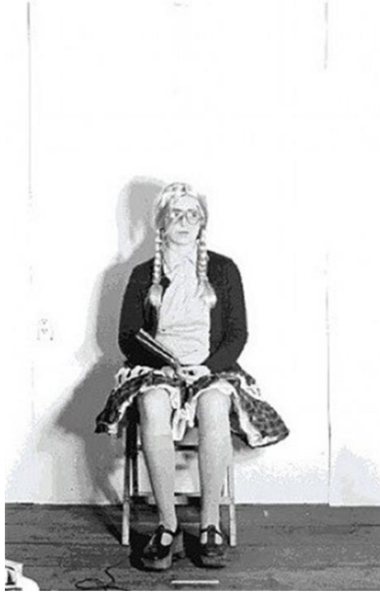
Görsel 2: Cindy Sherman, İsimlessiz, #434, 1976

Kolaj ve hazır imgeleri kullanan Barbara Kruger ise, tüketim toplumuna dair mesaj ve kodları daha grafiksel bir zemine oturtmaktadır. Kadını sorgulayan farklı görsel ve imgelerden alınan alıntılar, bir araya getirilerek kendinden müdahalelerle daha iletişimsel yönü güçlü bir afiş havasındadır. İmgelerin alıntılanmasıyla oluşan kompozisyonlarıyla ilgili olarak Gompertz şöyle belirtmektedir: