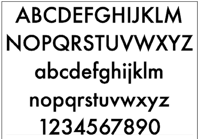
Şekil 2. Paul Renner tarafından tasarlanan Futura yazı karakteri ( https://www.digitalartsonline.co.uk , 2021).

İlk metin oyunu olan 'Text Adventure', Crowther & Woods tarafından 1977 yılında yapılmıştır. Metin oyunları aksiyon oyunlarının tersine hızlı reflekslerle değil dikkat gerektiren ve metinsel olup oyuncu ile iletişim kurularak oynanan oyunlardır.