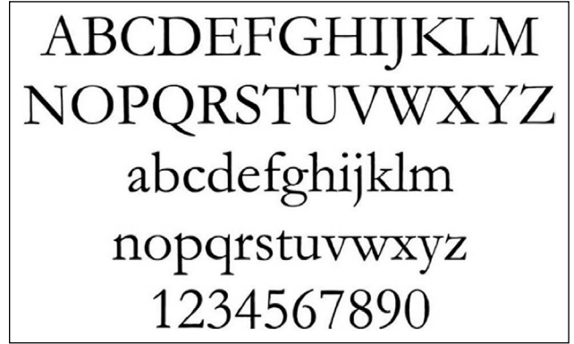
Şekil 1. Claude Garamond tarafından tasarlanan Garamond yazı karakteri ( https://medium.com/ , 2021).

Bilgisayar oyunu tasarımcısının çalıştığı ortamı iyice anlaması gerekir. Bu bilgisayar özel olanaklar sunar ve