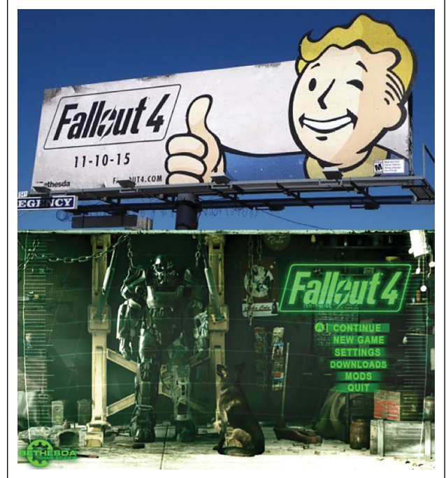
Şekil 5. Fallout 4.

Zemin içinde kullanılan yazı tipinin rengi ile ayırt edici olması oyuncunun oyuna adapte olarak dikkat çekmektedir.