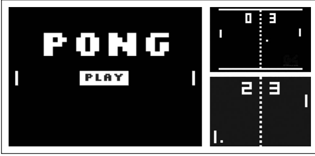
Şekil 3. Pong ( https://www.sitepoint.com , 2021).

her öğenin oyuncun öğrenme sürecine de katkı sağladığı düşünülerek hazırlanmalı ve tasarlanmalıdır. Öğrenirken düşünebilmeyi, okuyup anlayabilmeyi sağlayan grafik öğeler seçilmelidir.