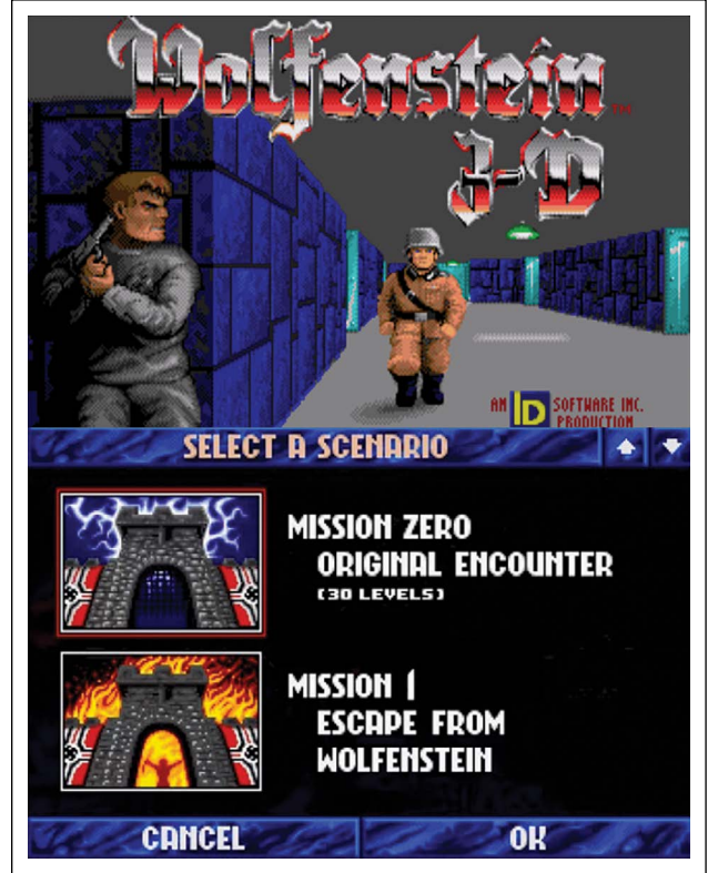
Şekil 4. Wolfenstein 3D.

Modern oyunlarda ise tipografi, oyunu daha estetik ve özgün kılan bir unsurun yanı sıra markalaşmanın da önemli bir etmenidir. Fallout 4'ün tanıtım afişlerinde ve billboardlarında kullanılan font ve logotype oyun menüsündeki ile aynı olması da tasarım açısından bütünlük sağlamaktadır.